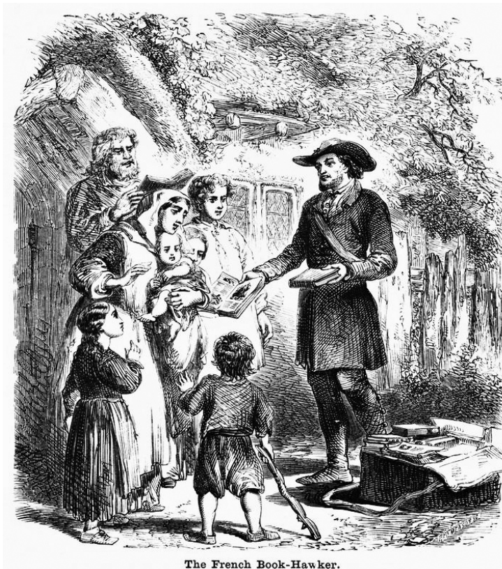
The French Book-Hawker.

Per abbozzare un ritratto che possa restituire la vivace fisionomia di