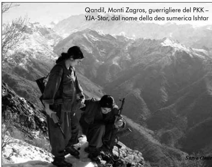
Qandil, Monti Zagros, guerrigliere del PKK – YJA-Star, dal nome della dea sumerica Ishtar

mai più che decennale in atto in Rojava e negli altri territori liberati dal PKK. Un'esperienza che, pur sotto continui bombardamenti, embarghi, attentati, omicidi mirati, resiste grazie a un autogoverno che rispecchia, e rispetta, la varietà etnica dei popoli che la abitano (curdi, armeni, arabi, circassi, assiri, turcomanni...) e grazie al protagonismo delle donne, la cui rottura