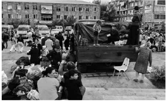
Immagini dell'esodo armeno dall'Artsakh, settembre 2023