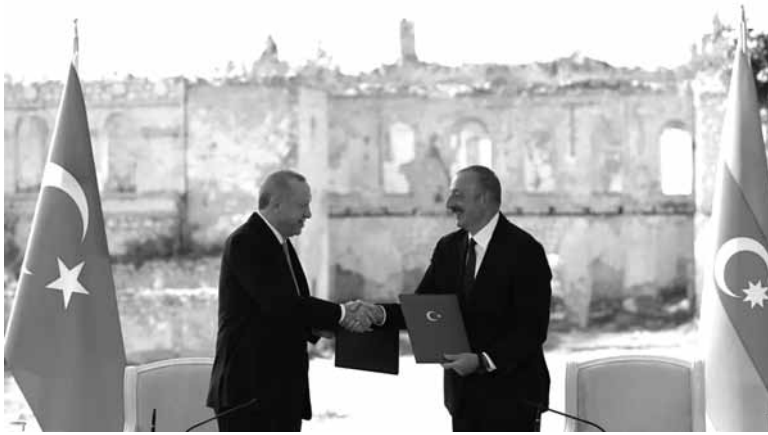
Stretta di mano tra il presidente turco Erdogan e quello azerbaijano Aliyev

La patria turca ( Vatan ) reclama il suo spazio vitale, glorifica i suoi martiri, e vuole le sue vittime, i suoi “nemici interni”. Armeni e curdi, per cominciare. Per questo tutto fa pensare che la pulizia etnica del Karabakh